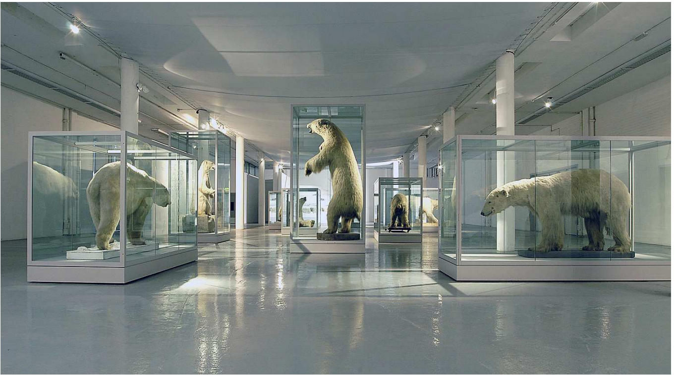
Abbildung 3: Spike Island Installation.