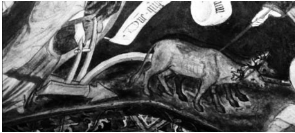
Abbildung 1: Bei der älteren Form des Anschirrens lag die ganze Belastung auf dem Nacken und Kopf des Tieres, statt wie beim jüngeren Kummel auf dem ganzen Rumpf.

Quelle: Fresko im Kreuzgang des Doms zu Brixen, um 1410; Peter Dinzelbacher.