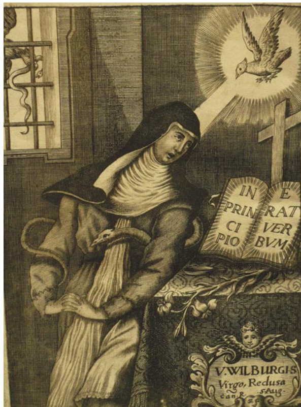
Abbildung 3: Die dritte Person Gottes in Taubengestalt erleuchtet eine Heilige, während sie der Dämon in Schlangengestalt bedrängt.

Quelle: Kupferstich aus der Vita der hl. Wilbirg von St. Florian: Triumphus castitatis, ed. B. Pez, Augustae 1715, Frontispiz; Peter Dinzelsbacher.