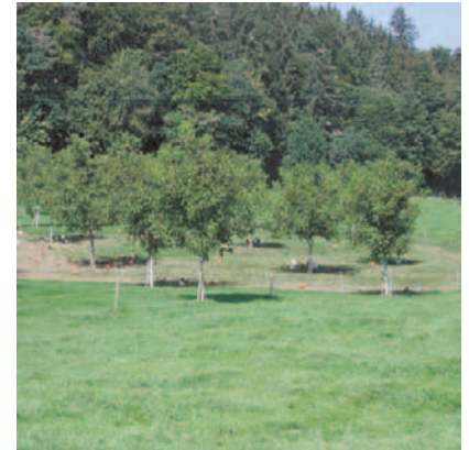
Hühner brauchen Schutz vor Greifvögeln.