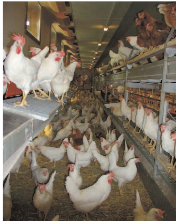
In der Voliere nutzen Hühner auch die räumliche Dimension. Sie können flattern und aufbaumen.

Hühner halten sich tagsüber meist auf dem Boden auf, aber bei Gefahr und zum Ruhen, fliegen sie durchaus erhöhte Plätze auf Bäumen an. «Volierenställe» entsprechen diesem natürlichen