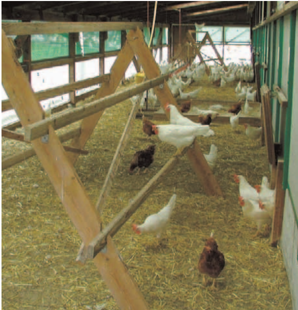
Im überdachten Schlechtwetterauslauf können Hühner picken, scharren, staubbaden und die Sonne geniessen.