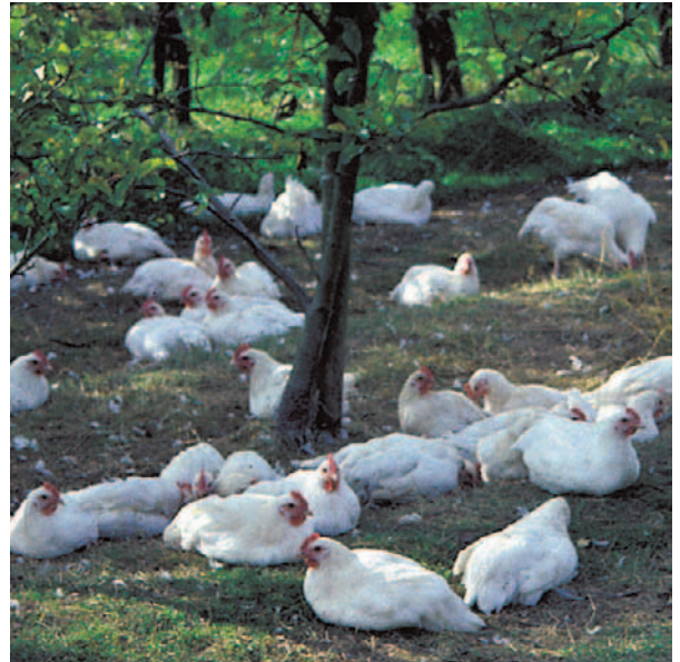
Auch Masthühner schätzen eine Weide.

Auch Masthühner haben Ansprüche, welche über das Fressen und Trinken hinausgehen. Sie wollen wie alle Hühner in der Einstreu scharren und staubbaden. Sie nehmen gerne erhöhte Sitzgelegenheiten an, wenn diese leicht erreichbar sind. Das Problem der schnell wachsenden Masthühner ist die einseitige Zucht auf extre-