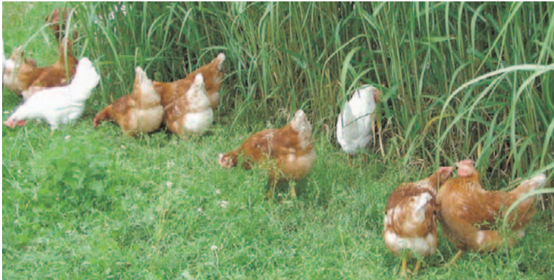
Hühner bewegen sich gerne entlang von Deckung, z.B. Gebüsch, Hecken oder Streifen von Chinaschilf.