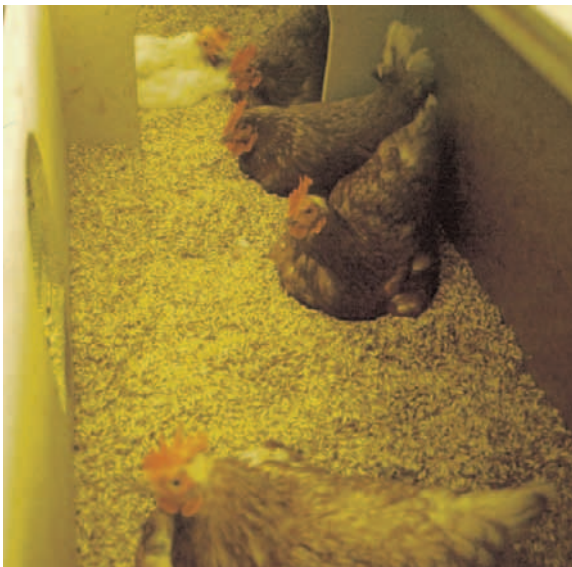
Hühner legen ihre Eier an einem geschützten Ort ab. Sie bevorzugen eingestreute Nester.

In der freien Natur legen Hennen Eier, um sie nachher auszubrüten. Die Henne sucht sich einen geschützten Ort abseits der Gruppe und polstert ihn mit etwas Gras und Laub zu einem weichen Nest aus. Jeden Tag oder jeden zweiten legt die Henne in den Morgenstunden ein Ei ins Nest, bis etwa sechs bis acht Eier gelegt sind. Manchmal werden auch von anderen Hennen Eier hinzuge-