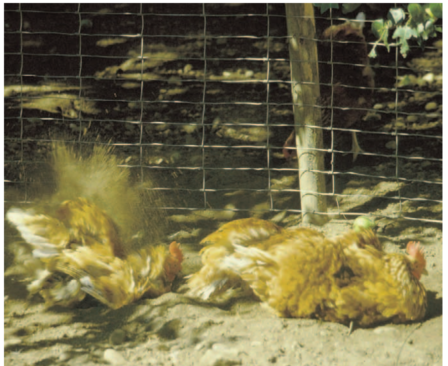
Nichts geht über ein Staubbad!

Wer Hühner im Freiland beobachtet, sieht, dass sie vor allem im Winter und Frühling mit ausgebreiteten Flügeln in der Sonne liegen. Dieses «Sonnenbad» beobachtet man bei vielen Vogelarten. Sonnenstrahlen wärmen die Tiere nicht nur, sondern schützen sie auch vor Krankheiten, weil UV-Strahlen schädliche Bakterien töten. Licht ist zudem für den Aufbau von Vitamin D wichtig. Hühner liegen aber nicht nur in die Sonne, sondern nehmen auch Staubbäder. Dabei scharren sie sich eine Mulde in die Erde oder die Stalleinstreu, legen sich hinein und scharren Staub in das Gefieder. Dieser bindet überschüssiges Fett und schützt vor lästigen Parasiten wie Federlingen oder Milben. Zum Sonnen- und Staubbaden eignet sich der Aussenklimabereich eines Stalles besonders gut.